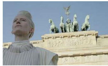
Bartana spiller selv rollen som en lys og hvidklædt messias, der vender tilbage til et af åstederne for jødeudryddelserne, Berlin.

Udstillingen, der var planlagt længe inden den 7. oktober, kredser også om identitet, både kønslig og national - og om forholdet mellem Israel og Palæstina.