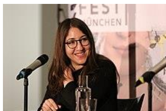
Deborah Feldman i 2017.

Deborah Feldman fortalte i sin første erindringsbog, Uortodoks , den uafrystelige historie om at vokse op i et hasidisk miljø i Williamsburg, New York. De sekteriske traditioner og skikke var dybt forankret i en gren af ultraortodoks jødedom, som voksede ud af asken efter holocaust. Alle hensyn angik slægtens overlevelse på bekostning af det enkelte individ.