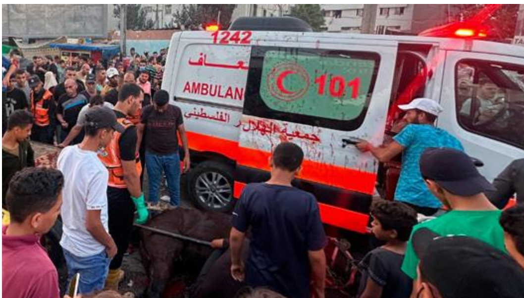
"Den sønderbombede ambulance" i Politiken, 4. november 2023.

Dagbladet Politiken kalder bizart nok ambulancen for "sønderbombet," selvom den på fotoet i avisen tydeligt fremstår stort set intakt. Altså, hvor tosset kan det blive? Bilens kofanger er faldet halvt af, og så er der tilsyneladende blod på siden af ambulancen. Men de fleste kan nok blive enige om, at den ikke just ligner resultatet af et missilangreb.