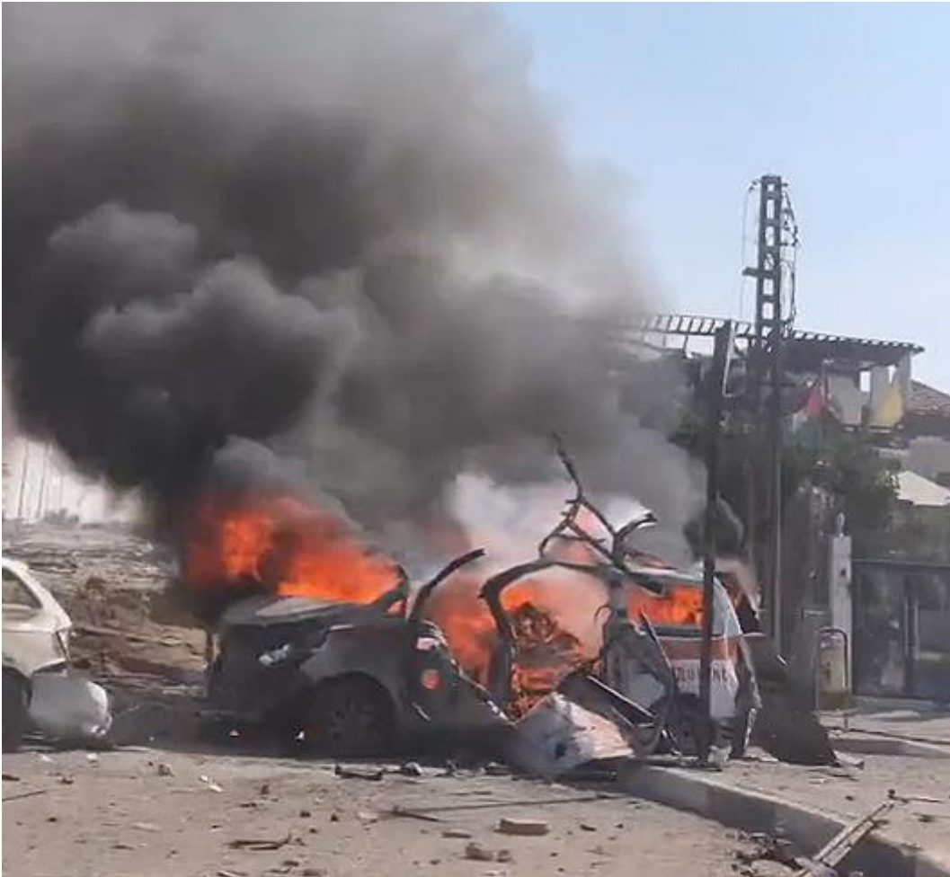
Brændende ambulance ved kystvejen, 3. november 2023.

Billedet ovenfor er fra en video ( som kan ses her ) af ambulancen, som blev angrebet på kystvejen.