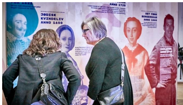
Billede fra omtalen i Kristeligt Dagbladfredag den 18. november.